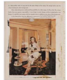
Sir Eduardo Paolozzi You'll Soon Be Congratulating Yourself, 1949 Collage, 30,5 x 23 cm Victoria and Albert Museum, London

Abdruck nur in Verbindung mit einer Berichterstattung zur Ausstellung / To be reprinted only in connection with a press coverage of the exhibition / Reproduction seulement en relation avec un article lié à l'exposition