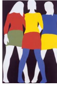
Franz Gertsch Mireille, Colette, Anne, 1967 Dispersion auf Papier auf Pavatex, 118 x 77 cm Aargauer Kunsthhaus Aarau © 2007 Franz Gertsch