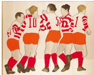
Konrad Lueg Fussballspieler, 1963 Tempera auf Leinwand, 135 x 170 cm Sammlung Deutsche Bank © 2007 ProLitteris, Zürich