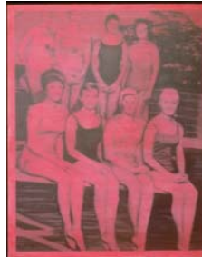
Gerhard Richter Schwimmerinnen, 1965 Öl auf Leinwand, 200 x 160 cm Sammlung Froehlich, Stuttgart © 2007 Gerhard Richter