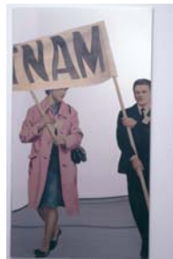
Michelangelo Pistoletto Vietnam, 1965 Bemaltes Seidenpapier auf polier- tem Stahl, 220 x 120 cm The Menil Collection, Houston © 2007 Michelangelo Pistoletto