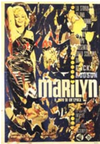
Mimmo Rotella Marilyn, 1963 Décollage, 190 x 132 cm Privatsammlung