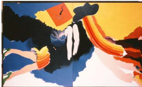
Allen Jones Man/Woman, 1963 Öl auf Leinwand, 214,6 x 188,6 cm Tate, presented by the Contemporary Art Society, 1968 © 2007 Allen Jones