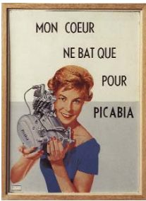
Jean-Jacques Lebel Mon coeur ne bat que pour Picabia, 1962 Collage, 55,5 x 41,5 cm Musée d'Art Moderne de la Ville de Paris