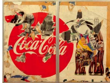
Wolf Vostell Coca-Cola, 1961 Décollage, 200 x 300 cm Museum Ludwig, Köln