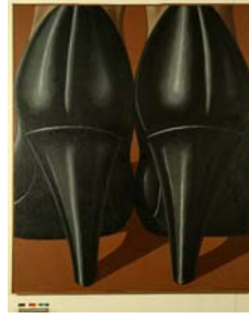
Domenico Gnoli Lady's feet, 1969 Öl und Sand auf Leinwand, 191 x 161 cm Von der Heydt-Museum Wuppertal