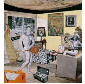
Richard Hamilton Just what is it that makes today's homes so different, so appealing?, 1956 Collage, 26 x 25 cm Kunsthalle Tübingen, Sammlung Zundel © 2007 ProLitteris, Zürich