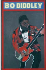
Peter Blake Bo Diddley, 1963 Acryl auf Hartfaser, 122,4 x 76 cm Museum Ludwig, Köln, Stiftung Ludwig, 1976 © 2007 ProLitteris, Zürich