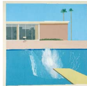
David Hockney A Bigger Splash, 1967 Acryl auf Leinwand, 242,5 x 243,9 cm Tate © 2007 David Hockney Studio, Los Angeles