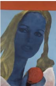
Martial Raysse Visage en bleu, 1963 Acryl auf Leinwand auf fotografischer Reproduktion auf Karton, 146 x 97 cm IVAM, Institut Valencià d'Art Modern, Generalitat © 2007 ProLitteris, Zürich