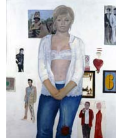
Pauline Boty The Only Blonde in the World, 1963 Öl auf Leinwand, 122,4 x 153 cm Tate © 2007 Estate of Pauline Boty