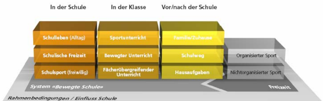
Abbildung 2: Modell der Bewegten Schule, Baspo, 2008, S. 3

Die EDK spricht sich in ihrer Erklärung „Bewegungserziehung und Bewegungsförderung in der Schule“ vom Oktober 2005 dafür aus, dass der Sportunterricht durch Bewegungsförderung im Schulalltag ergänzt werden soll. Der Bewegungsförderung und Bewegungserziehung in der Schule soll in Zukunft ein noch stärkeres Gewicht beigemessen werden. Nebst dem obligatorischen Sportunterricht sollen die Chancen der Bewegung auch in anderen Schulfächern, im Schulalltag und im Schulumfeld genutzt werden. Das Ziel ist die Bewegte Schule, wie sie in Abbildung 2 dargestellt ist. Einzelne Bausteine können auch isoliert entwickelt-, bevor sie zu einem Ganzen geschmiedet werden. Hinter allen Formen und Umsetzungen der bewegten Schule steckt die gemeinsame Absicht, die Schule als einen Bewegungsraum zu verstehen und das gesamte Schulleben bewegt(er) zu gestalten. Massnahmen zur Umsetzung sind durch eine Arbeitsgruppe unter der Leitung der KKS (Konferenz der Kantonalen Sportbeauftragten) zusammengestellt worden.